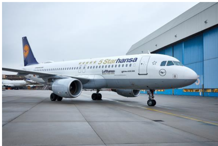
[루프트한자는 스카이트랙스 '5스타 항공사' 등급 획득을 기념해 일부 노선에 래핑 항공기를 운항한다]