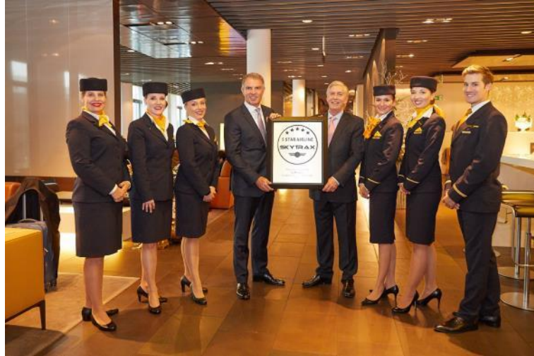
[카르스텐 슈포어 루프트한자 그룹 CEO(왼쪽 4번째) 및 임직원들이 에드워드 플레이스테드 스카이트랙스 CEO(오른쪽 4번째)로부터 '5스타 항공사' 인증패를 수여받았다]